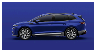
Energy Blue, uni