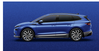
Modrá Race, metalická