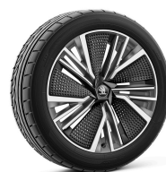
Neptune Antracitové s aero krytom