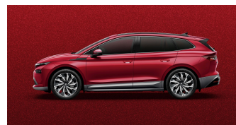
Červená Velvet, metalická