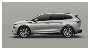
Sívá Steel, uni