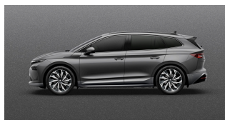
Sívá Graphite, metalická