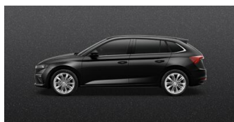
Čierna Magic, metalická