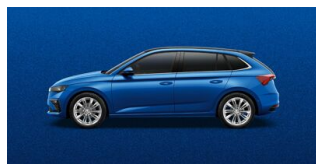
Modrá Race, metalická