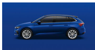
Modrá Energy, uni