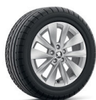
Cortadero Aero 16" striebové