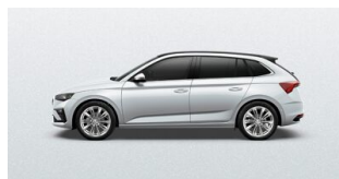
Biela Moon, metalická