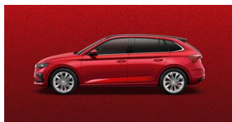
Červená Velvet, metalická