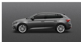
Sivá Graphite, metalická