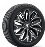
Propus Aero 17" čierne