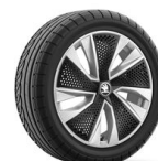
Kajam 17" striebové s aero krytmi