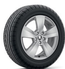
Nyota 16" striebové