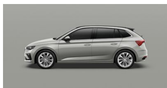
Sivá Steel, uni