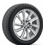
Stratos 17" striebové