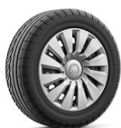
Ocelové disky 16" s krytmi Tecton