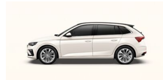
Biela Candy, uni