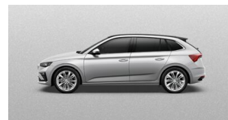
Strieborná Brilliant, metalická